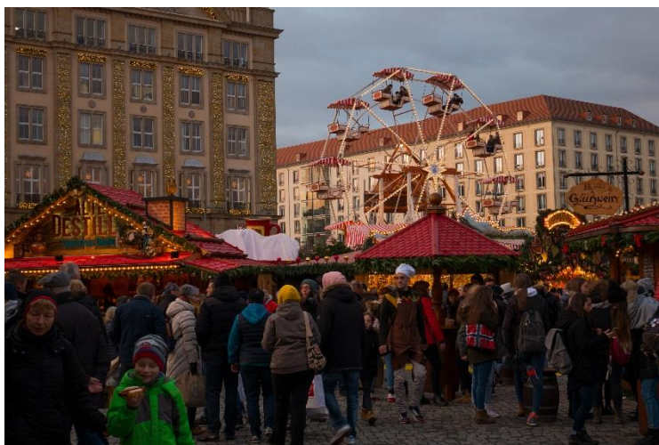
Pohled na Atmarkt - Jiří Štafka